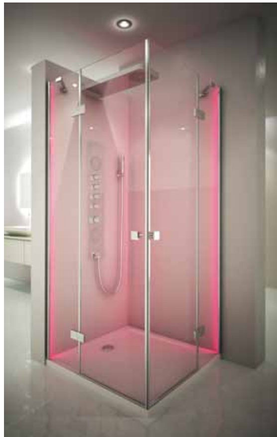
Kabina kwadratowa 90 x 90 cm