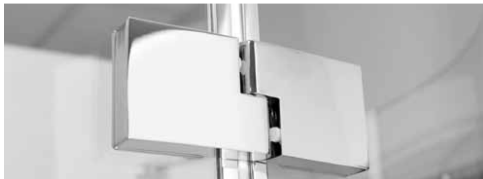
Chromowane unoszone zawiasy