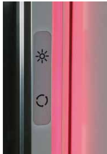
Subtelný sterownik zintegrowany z profilem